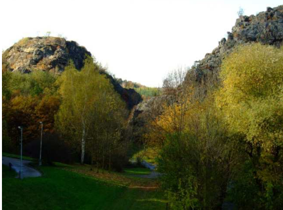
Vstup do skalní soutěsky Divoké Šárky.

Během monitoringu pomocí ultrazvukových detektorů bylo na území Divoké Šárky a v okolí nádrže Džbán zaznamenáno celkem 9 – 10 druhů netopýrů. Jedná se o netopýra rezavého, n. vodního, n. večerního, n. nejmenšího, n. parkového, n. řasnatého, n. vousatého/Brandtova a dokonce i kriticky ohroženého n. černého a n. velkého. Nejvíce druhů zde bylo pozorováno na konci srpna, v období začínající podzimní migrace netopýrů. V šáreckém údolí se nachází také štoly, kde někteří netopýři pravidelně zimují.