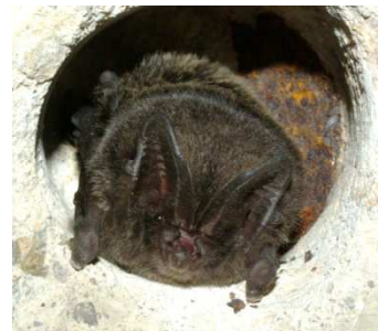
Listnaté lesy v PR Divoká Šárka využívá jako lovecké stanoviště i kriticky ohrožený netopýr černý.