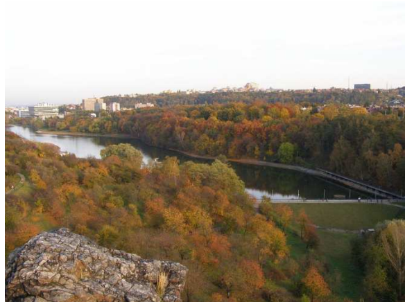
Pohled na rozsáhlou plochu vodní nádrže Džbán.