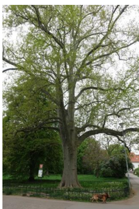
Památný platan s úkrytem netopýrů rezavých.