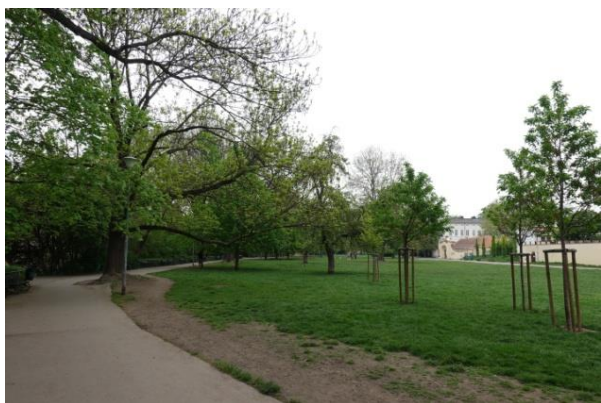
Travnaté parkové plochy v parku na Kampě.

Pro pozorování netopýrů v teplé části roku je vhodným místem park na Kampě. Jedná se rovněž o ostrov, který je od Vltavy oddělen mlýnskou strouhou Čertovkou. Travnaté parkové plochy a staré stromy s dutinami poskytují netopýrům dobré potravní i úkrytové příležitosti. Během výzkumu zde bylo zjištěno celkem 6 druhů: netopýr rezavý, n. nejmenší, n. parkový, n. hvízdavý, n. vodní a n. večerní.