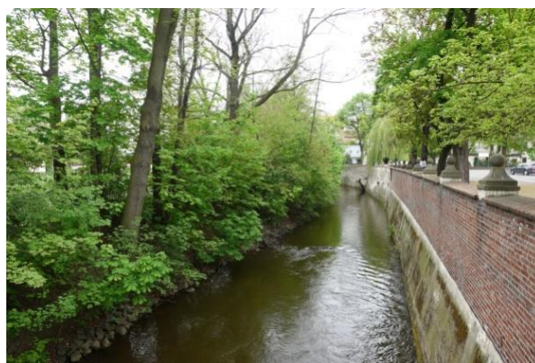
Mlýnská strouha Čertovka.