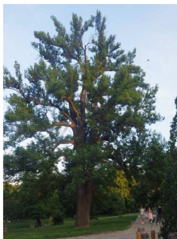
Jasan ztepilý s dutinami obývanými netopýry hvízdavými.

Při průzkumu v letech 2015 a 2016 bylo v parku pozorováno 59 druhů ptáků, z toho 45 v hnízdním období a 25 hnízdicích (podrobnější informace najdete ve studii Černého a Šebely 2018). Při chiropterologickém výzkumu zde byl potvrzen výskyt 7 druhů netopýrů: netopýr nejmenší, n. hvízdavý, n. večerní, n. rezavý, n. vodní, n. ušatý a n. Saviův.