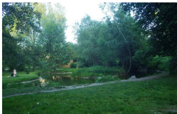
Kašna a jezírko s ostrůvkem – vodní plochy, které jsou pro netopýry velmi atraktivní.