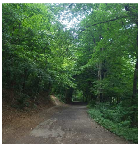
Třetí pozorovací bod na mostku přes potok Říčka a navazující letový koridor nad turistickou cestou.