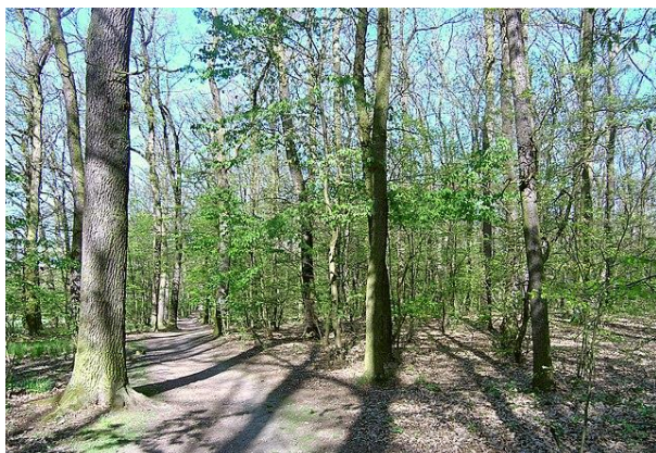
Interiér Milíčovského lesa.

Staré stromy skýtají řadu možností úkrytů pro netopýry (v dutinách, štěrbinách), pestrá společenstva rostlin a na ně vázaného hmyzu pak vhodná potravní stanoviště. Další úkryty netopýrů se nachází v panelových domech blízkého Jižního města. Celkem zde bylo zjištěno 8 druhů netopýrů: n. rezavý, n. stromový, n. vodní, n. velký, n. řasnatý, n. hvízdavý, n. parkový a n. nejmenší.