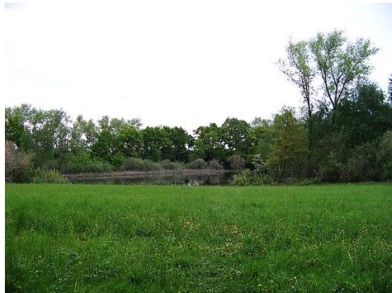
Rybník Homolka s mokřadní loukou.