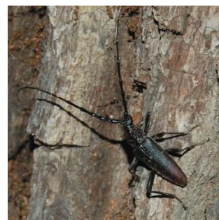
Chodbičky larev a dospělý tesařík obrovský.