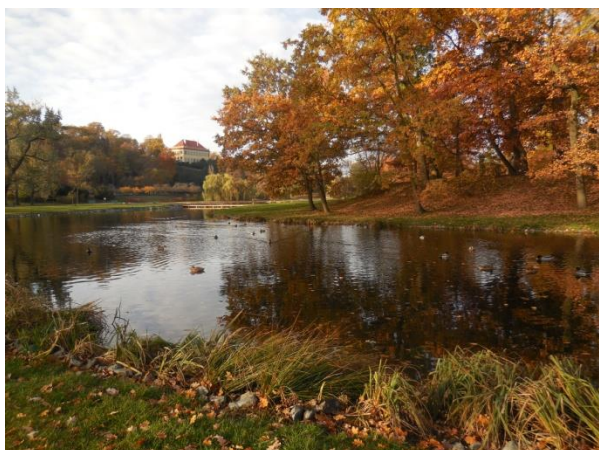
Vodní plochy kolem dubového pahorku.

Tato pestrost stanovišť láká mnohé druhy živočichů od hmyzu přes obojživelníky, vodní ptáky až po netopýry. Ti zde nalézají dostatek potravy, ale také úkryty v dutinách a štěrbinách stromů. Údolí podél řeky Vltavy využívají netopýři jako letový koridor při migracích, stromové úkryty zde proto hojně osídlují zejména v době námluv a zimování. Celkem bylo ve Stromovce dosud zjištěno 11-12 druhů letounů: netopýr velký, n. řasnatý, n. vodní, n. večerní, n. rezavý, n. pestrý, n. černý, n. parkový, n. hvízdavý, n. nejmenší a n. ušatý, příp. dlouhouchý.