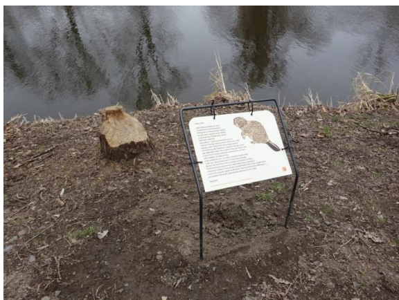
Bobří okusy u Malé říčky.