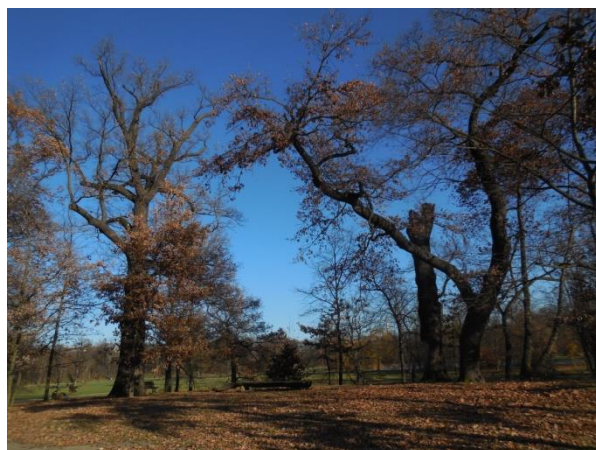
Staré duby a jejich torza na pahorku.