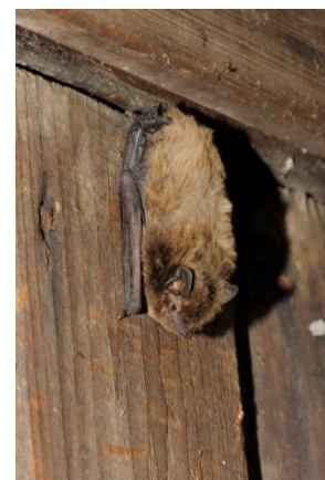
Celoroční netopýří budka a netopýr parkový.